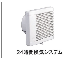
24時間換気システム